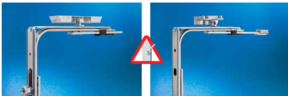
Eckumlenkung für Spaltlüftung

An Kunststoff-Dreh- und Dreh-Kipp-Fenstern mit i.S.-Sicherheits-Rollzapfen bewirkt das Spaltlüftungsschließeteil das Abstellen des Flügels in die Spaltlüftungsstellung.