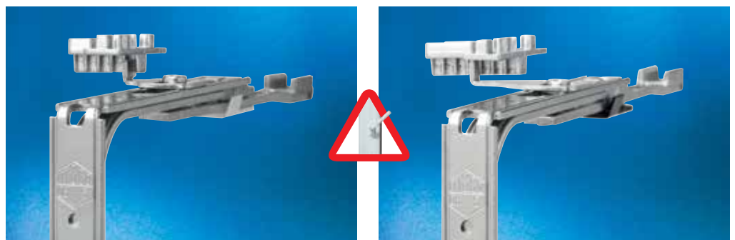
Eckumlenkung für Mehrfachlüftung mit fünf Lüftungsstellungen

Zentralverschluss, einer Standardschere, Schließteilen und einem Fenstergriff mit 45-Grad-Rastposition.