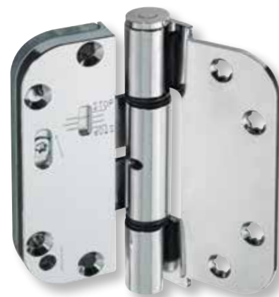
Einstellbereich: +/- 3 mm

Das Haustürband T80 C Composite ist in allen Dimensionen +/- 3 mm direkt und stufenlos verstellbar.