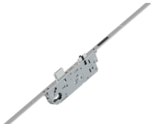
MACO PROTECT A-TS