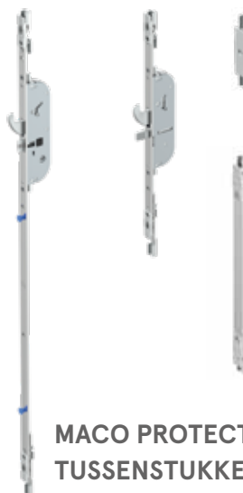
MACO PROTECT TUSSENSTUKKEN

MACO Beschläge BV Stikkenweg 60 verkoop@maco.eu