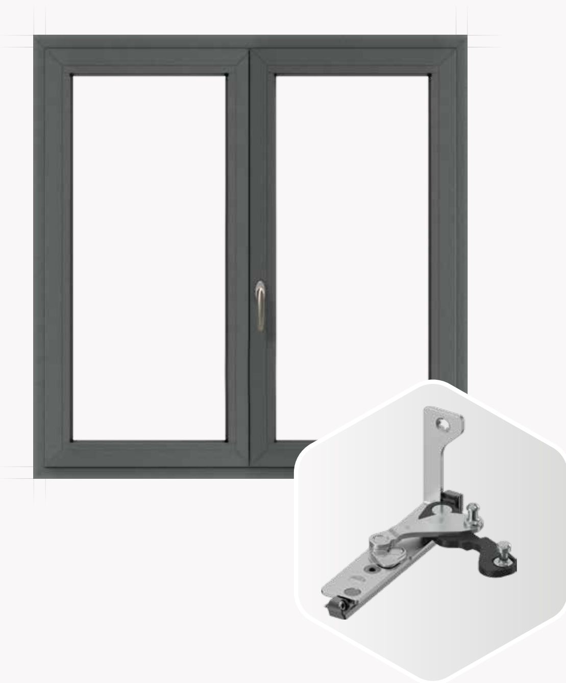
Multi Power clipable

¿Herraje oculto en ventanas de aluminio con Canal 16? ¡Por supuesto! Multi Power clipable es muy cómodo de montar siguiendo el principio de "clipar en lugar de atornillar". Puede soportar pesos de hoja de hasta 120 kilogramos y, dependiendo del perfil, hasta 150 kilogramos en balconeras.