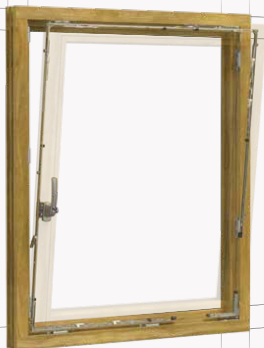
Ventana de seguridad