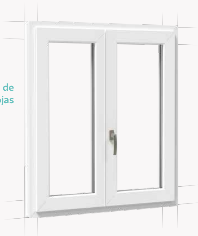
Ventana de dos hojas

Una bisagra oculta que funciona en todas partes: ¿ventanas estándar?, ¿de dos hojas?, ¿o más de dos hojas?, ¿de seguridad?, ¿ventanas enrasadas? Sea lo que sea lo que usted necesita, MACO Multi Power cumple con todos los requisitos.