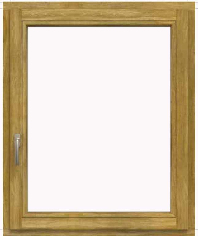
Meccanismi a scomparsa