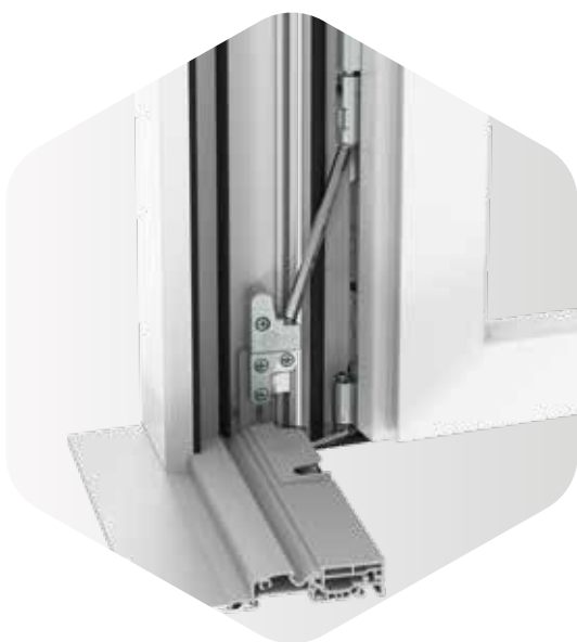
Soglia con portafinestra in PVC

Una portafinestra o portabalcone per far entrare più luce? Bella soluzione e, ovviamente, più pesante di una normale finestra, ma con l'asta di sostegno di MACO puoi arrivare a realizzare ante fino a 150 chili di peso con la soglia, e con i meccanismi a scomparsa! Grazie alla dima, l'asta di sostegno è molto facile da installare, anche in un secondo momento e il montaggio è molto veloce. Inoltre con questa soluzione il peso dell'anta non grava totalmente sulla cerniera angolare, aumentandone così la durata di funzionamento.