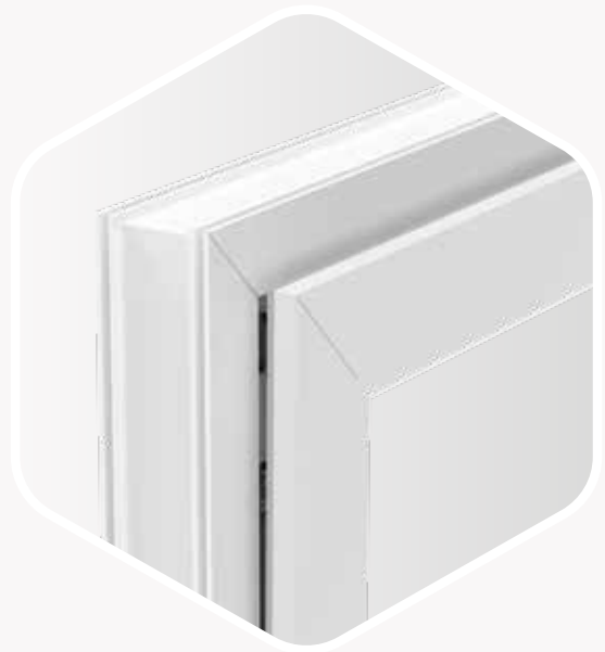
Finestra con forbice per aerazione