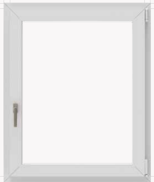
Meccanismi in vista