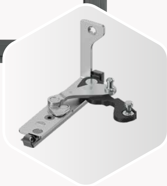
Multi Power a contrasto