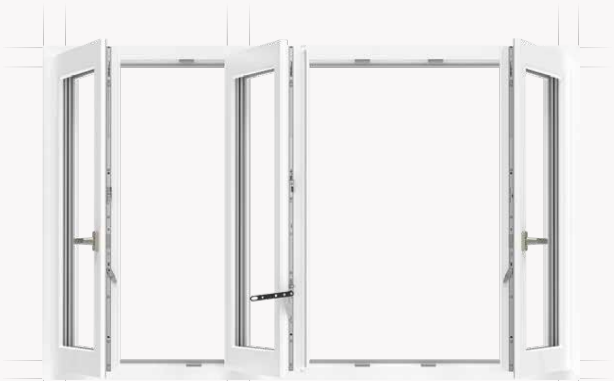
Finestra a più battenti