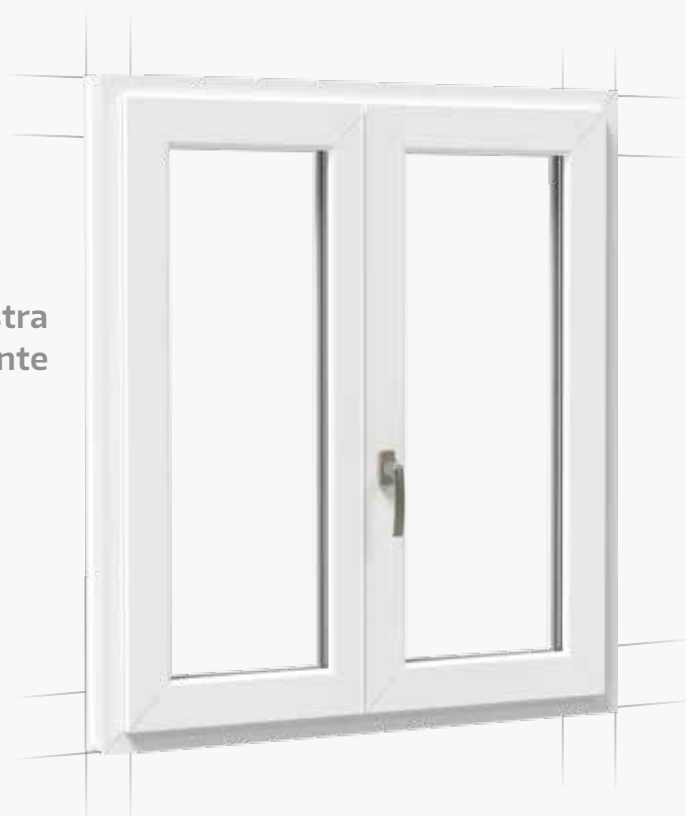
Finestra a due ante

Meccanismi a scomparsa per molte soluzioni di serramenti: finestre standard, a due o più ante, complanari e anche antieffrazione. Qualunque sia la richiesta del tuo cliente, con MACO Multi Power puoi realizzarla.