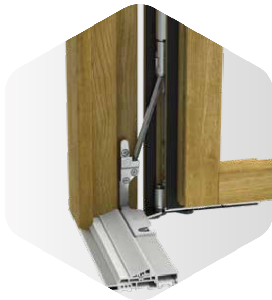
Soglia con portafinestra in legno

La soluzione con l'asta di sostegno è indicata anche per montaggi su soglia a pavimento.