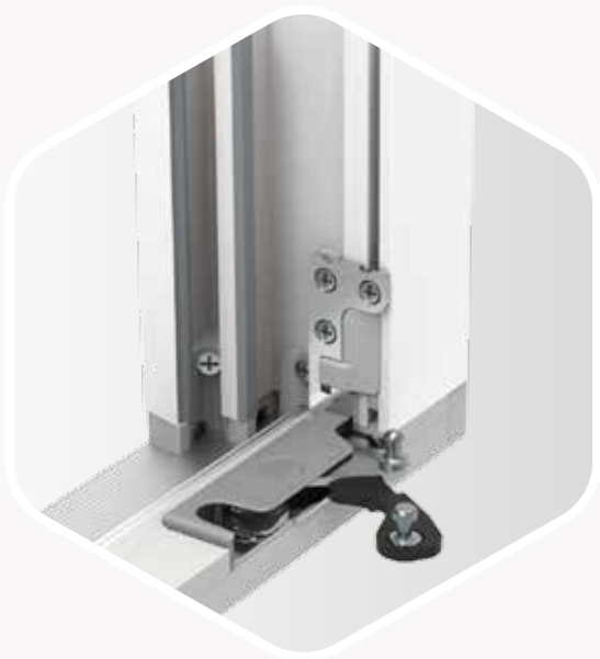
Portafinestra con soglia