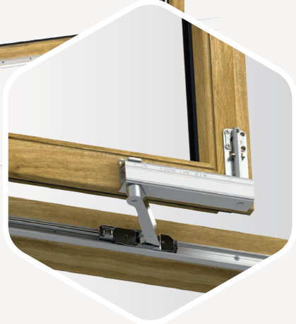
LAUFWAGEN 160 KG