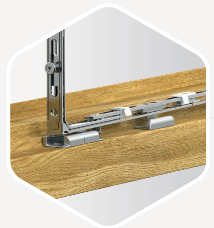
SCHNAPPER AM WINKELTRIEB Ermöglicht Selbsteinrastung unten