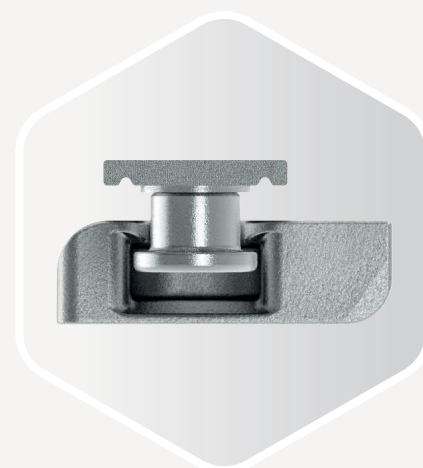
GALET DE SÉCURITÉ De série

La protection contre l'effraction est l'une des exigences les plus importantes pour les fenêtres, les portes et les portes-fenêtres. C'est pourquoi nous vous livrons de série le galet i.S. (« sécurité intelligente », en abrégé « i. S. ») et ce dès la variante de base. Celui-ci veille à ce que la sécurité soit nettement accrue. On ne peut donc pas descendre en dessous de la Résistance Class 2 pour vos systèmes coulissants et basculants.