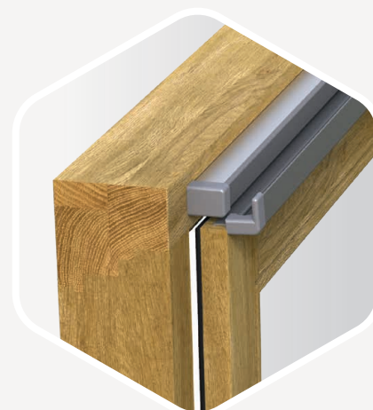
DISTANCE D'ARRÊT LORS DE L'AÉRATION Cinq millimètres seulement – invisibles de l'extérieur