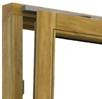
VENTILATION BASCULANTE SKB-Z Laisse entrer l'air frais

Coulisser avec de l'air frais : c'est SKB-Z. L'alternative au PAS si votre client souhaite une aération par basculement. Ce système de ferrures fonctionne également en mode auto-enclenchement, par une commande à une main qui ménage les forces. Lorsque la poignée est en position d'ouverture, la sécurité de blocage empêche la fermeture involontaire du vantail.