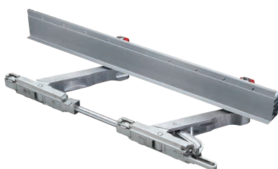
CHARIOT TANDEM SKB-Z Supporte un poids de vantail jusqu'à 200 kg