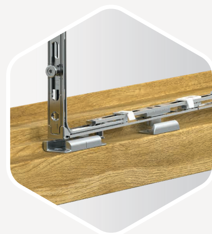
LOQUET SUR LE RENVOI D'ANGLE Permet l'auto-verrouillage en bas