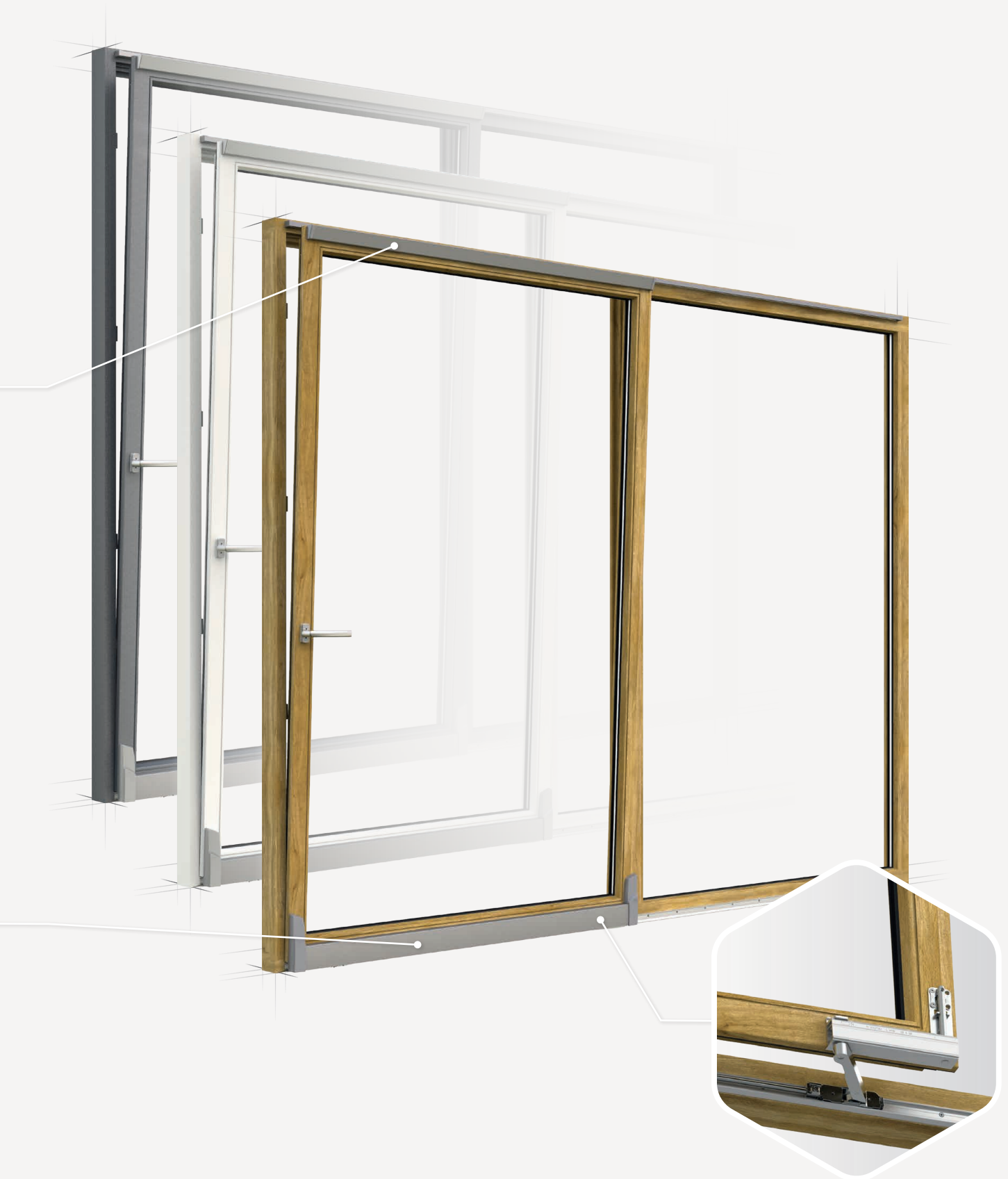
CHARIOT 160 KG